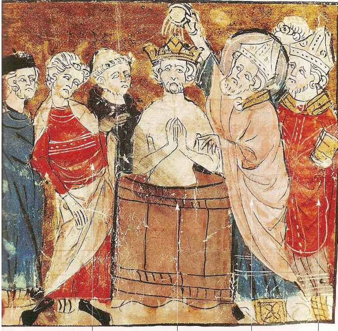
Le baptême de Clovis, enluminure, XIV ème siècle

3) Décris ce baptême. A quoi reconnaît-on Clovis ? A quoi reconnaît-on Saint-Rémi ?