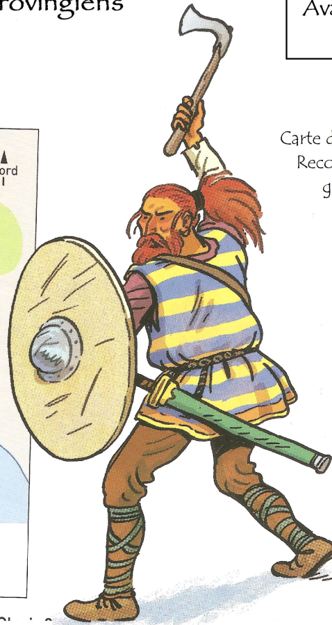
Carte du Royaume franc Reconstitution d'un guerrier franc

1) Où les Francs étaient-ils installés au début du règne de Clovis ?