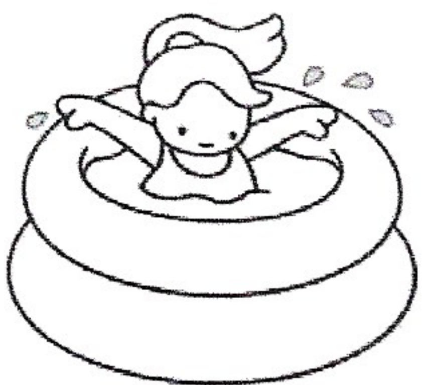
Une petite piscine