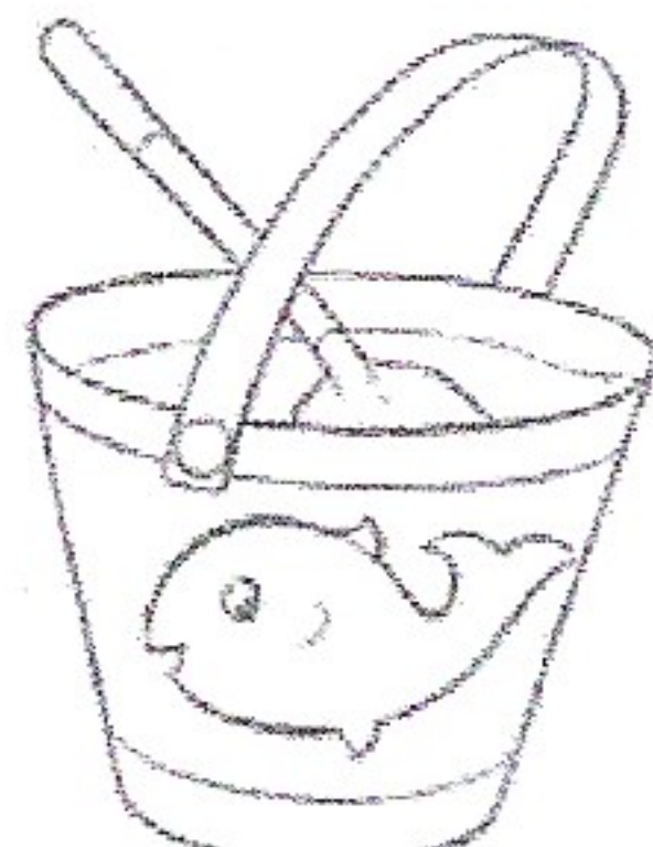
Un seau de plage