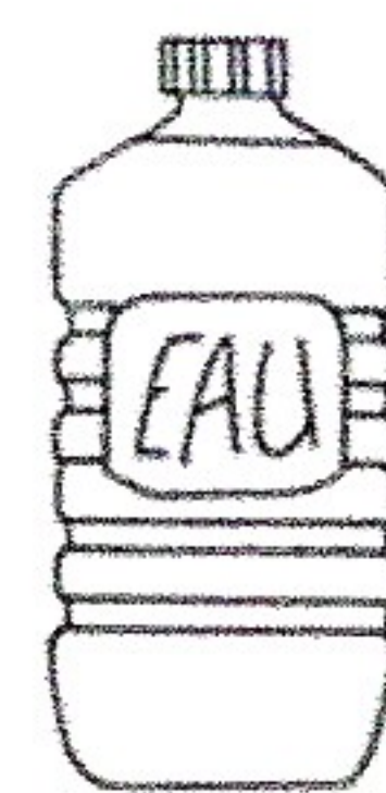
Une petite bouteille d'eau