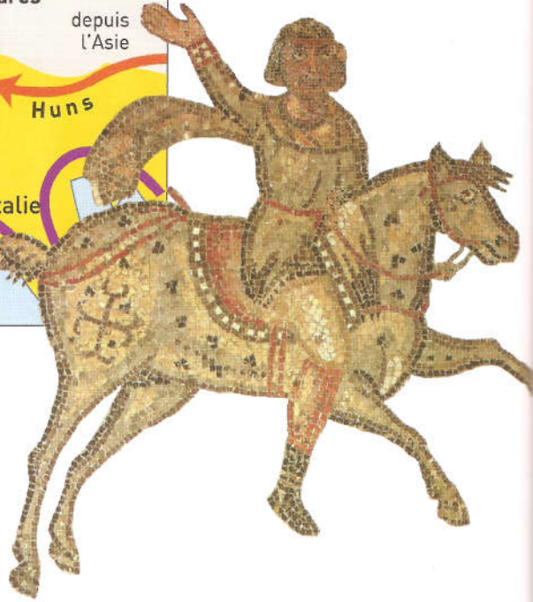
Carte des migrations barbares dans l'Empire romain Un guerrier barbare, mosaïque du VI ème siècle

1) A l'aide de la carte, explique par où les "Barbares" sont arrivés et quelles régions ils ont occupées.